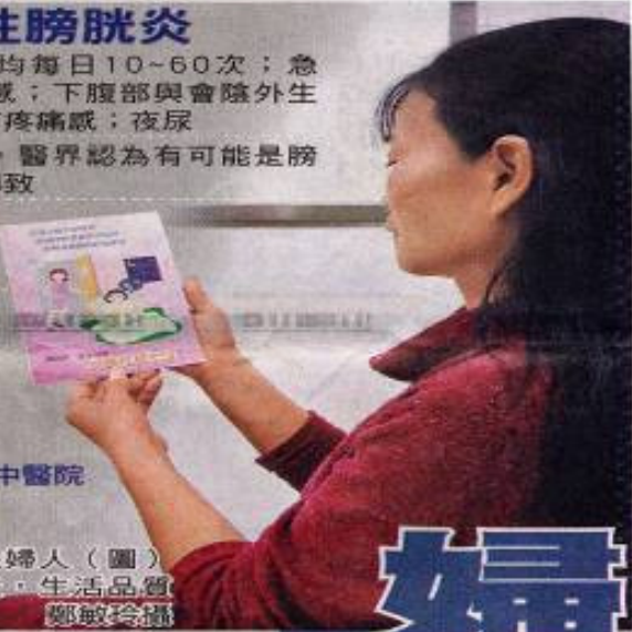
■四十五歲的黃姓婦人（圖）罹患間質性膀胱炎，生活品質和房事都受影響。