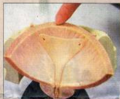
↑ 間質性膀胱炎明顯症狀是膀胱黏膜層有發炎現象，但造成的原因不明。